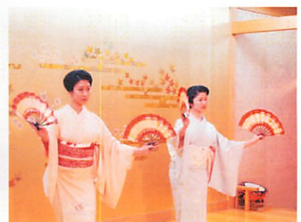
舞妓さんの京おどり