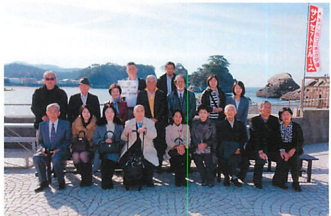
上天気の中西伊豆観光