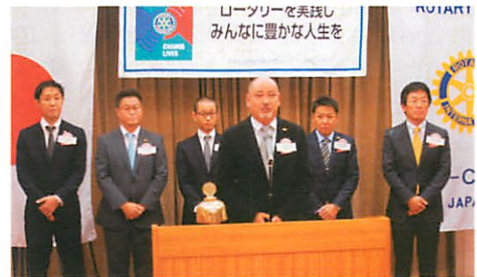
京都乙訓RCの皆さん