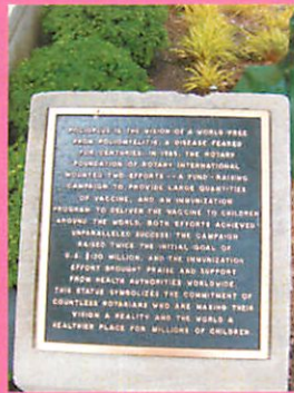
シカゴ ロータリー本部

事務所 静岡県三島市中央町4番9号 小野住環境中央町ビル2F TEL <055> 976-6351 FAX <055> 976-6352 例会場 ホテルサンバレー富士見 静岡県伊豆の国市古奈185-1 TEL <055> 947-3100 FAX <055> 947-0564