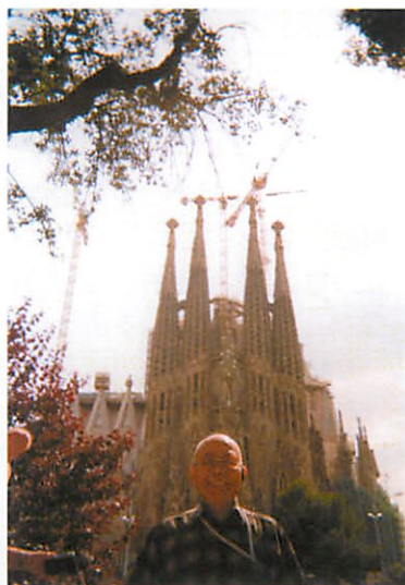
写真はサグラダ ファミリア聖家族教会