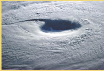
国際宇宙ステーションから見た台風8号

事務所 静岡県三島市中央町4番9号 小野住環境中央町ビル2F TEL (055) 976-6351 FAX (055) 976-6352 例会場 ホテルサンバレー富士見 静岡県伊豆の国市古奈185-1 TEL (055) 947-3100 FAX (055) 947-0564