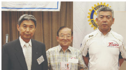
静岡県野球連盟田方支部