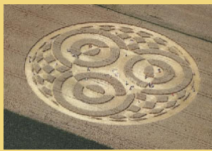
ドイツミステリーサークル出現

事務所 静岡県三島市中央町4番9号 小野住環境中央町ビル2F TEL (055) 976-6351 FAX (055) 976-6352 例会場 ホテルサンバレー富士見 静岡県伊豆の国市古奈185-1 TEL (055) 947-3100 FAX (055) 947-0564