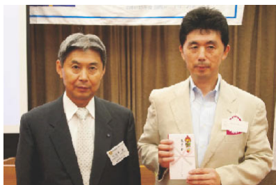
伊豆の国市観光協会

「選抜少年野球田方大会」は静岡県野球連盟田方支部が主催し、地元の小学生チーム15と県内の選抜チーム21の計36チームが一堂に会し、3日間に亘り熱戦をくり広げる学童軟式野球大会です。31年前から毎年8月下旬に開催され、今年で32回目の大会を迎えることとなりました。伊豆中央ロータリークラブ様の毎年の協賛金御支援には、役員一同厚く感謝致しております。8月23日開会式です。是非ご出席下さい。