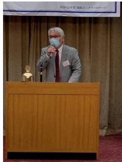
長友ガバナー補佐

IM はグループ担当クラブである伊豆中央 RC として今年度最大の事業です。例年ならば内容について検討し実施すればいいわけですが、今回はそれ以前に開催自体について大きな懸念が存在します。(中略)メンバーの皆様、また IM 各委員会が知恵を出し合い、このコロナ禍でも可能な新しい IM の形を創り開催していただくことを、静岡第 1 グループガバナー補佐としてお願い申し上げます。