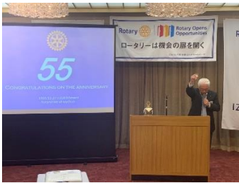
木内会員 乾杯挨拶